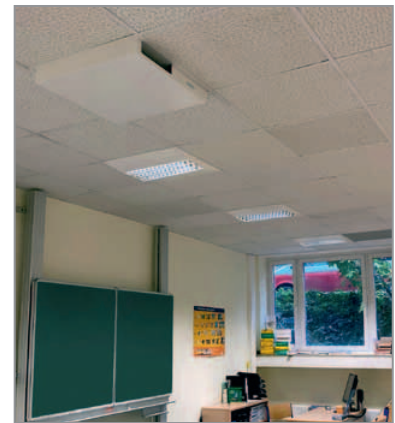
UV-C-Deckeneinbaugerät Cloud Air Control