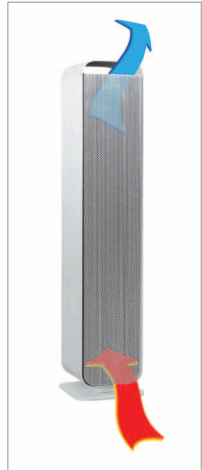
Luftführung durch das Geräteinnere